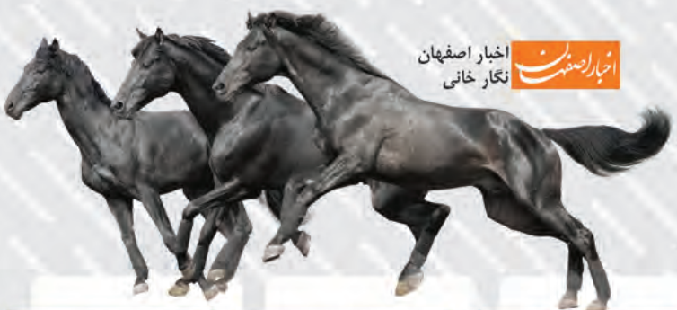
اخبار اصفهان | نگار خانگی

نژادهای بسیار مختلفی از اسب‌ها در سراسر جهان وجود دارند. با ما همراه شوید و به این نوشتار نگاهی بیندازید تا با ۲۰ محبوبترین و بهترین نژاد اسب‌ها در جهان آشنا شوید.