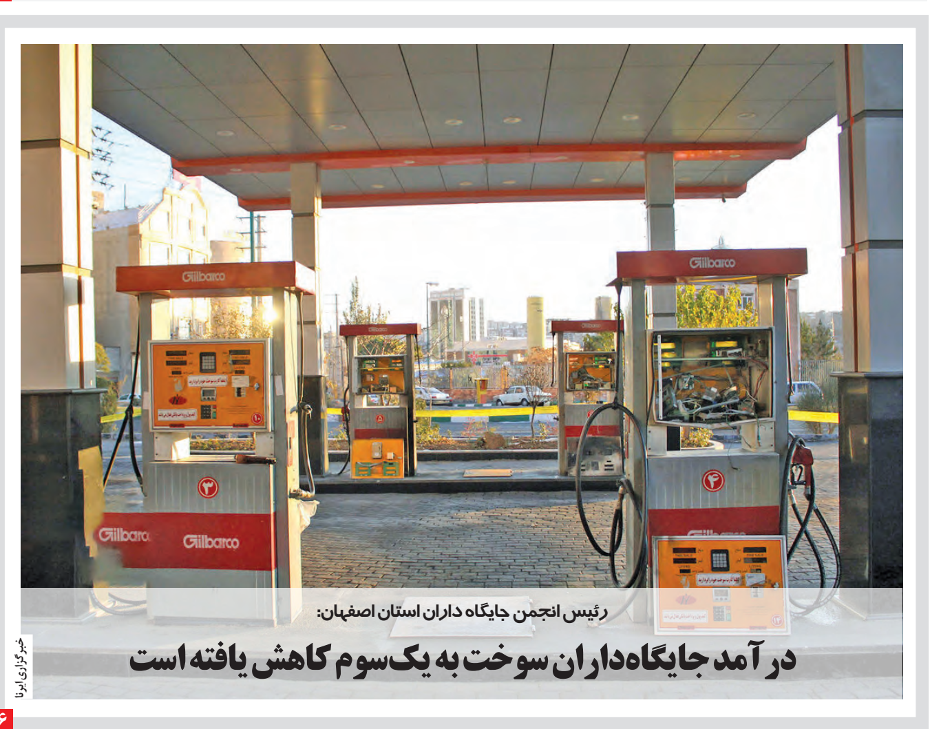
رئیس انجمن جایگاه داران استان اصفهان: در آمد جایگاه داران سوخت به یک سوم کاهش یافته است