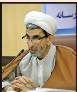
رئیس کل دادگستری اصفهان: