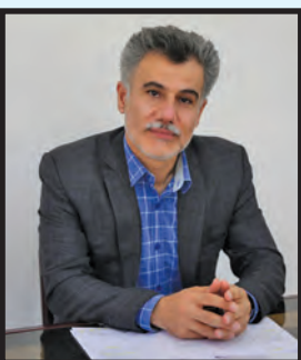
پیش بینی مدیر آفای و بازرسی برای تامین آب شرب پایدار: